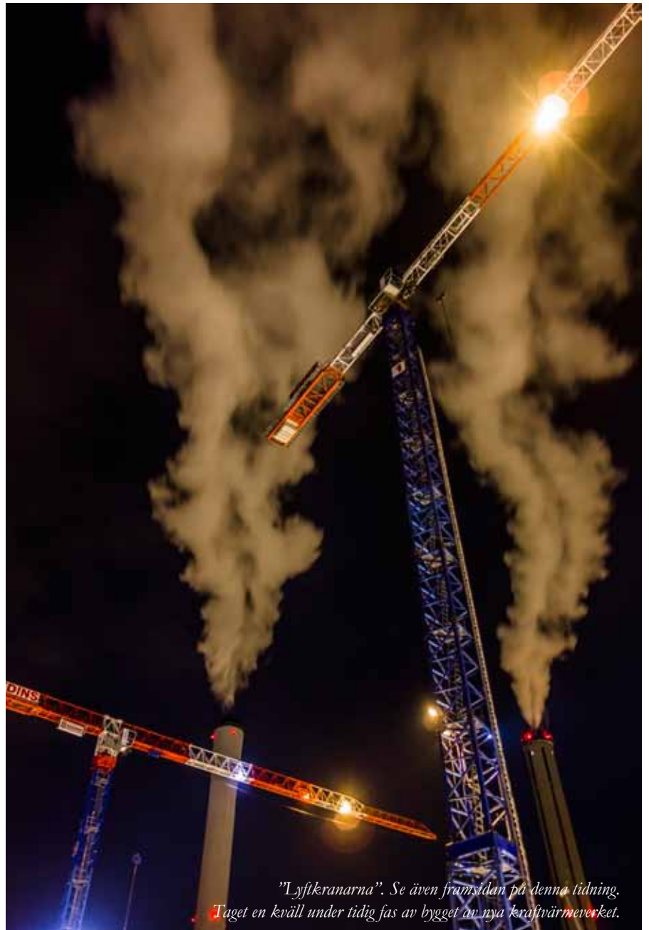
"Lyftkranarna". Se även framsidan på denna tidning. Taget en kväll under tidig fas av bygget av nya kraftvärmeverket.

Jag försöker även hitta variation i bilderna jag tar, då jag skulle bli uttråkad av att ta samma typ av bilder om och om igen. För mig handlar det om att hitta en känsla motivet förmedlar, samtidigt som jag skapar något nytt i och med kompositionen och att det inte bara är rent avbildande. Det är viktigt att tänka på när man fotograferar byggnader skapade av andra: hur